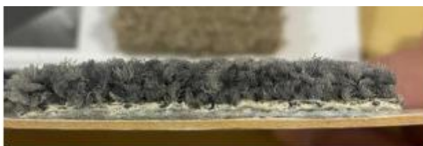
Modelo ilustrativo – espessura do carpete